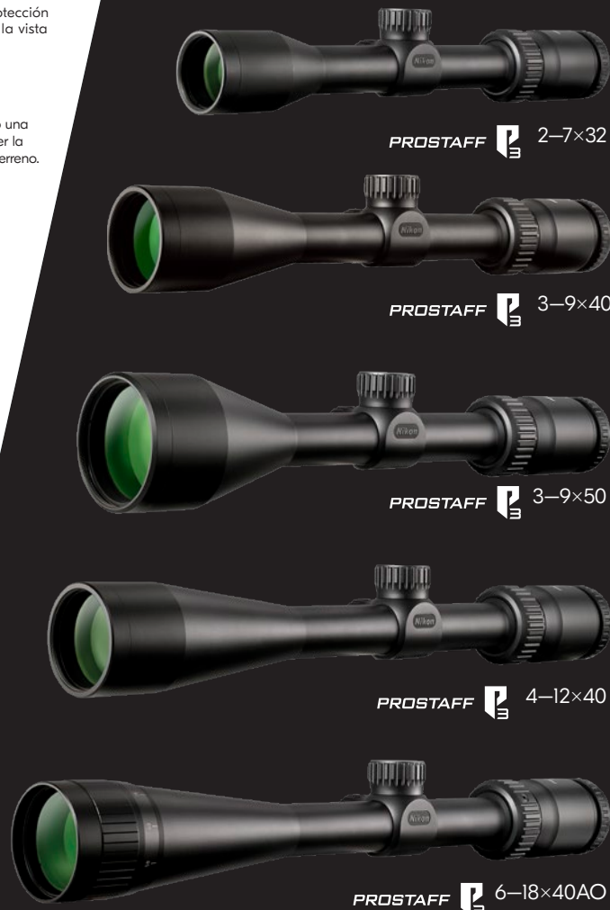
PROSTAFF P3 2-7×32